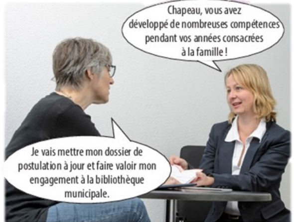
Elle prend conseil chez frac/fraw où elle établit un bilan de compétences. Dans ce processus, elle réalise qu'elle veut changer de métier et chercher un emploi dans le monde des livres.