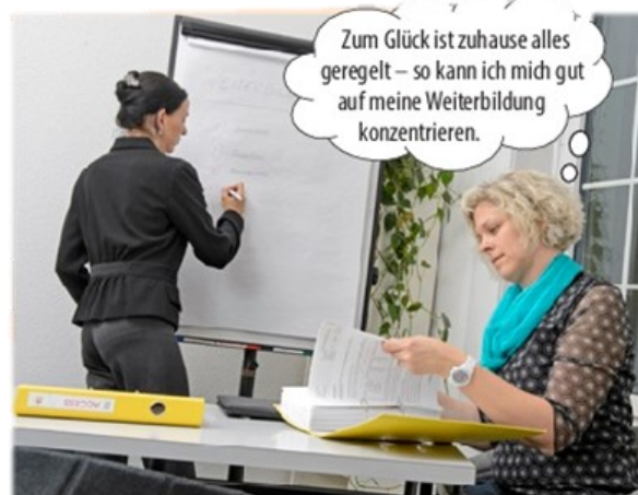
Drei Monate später ...