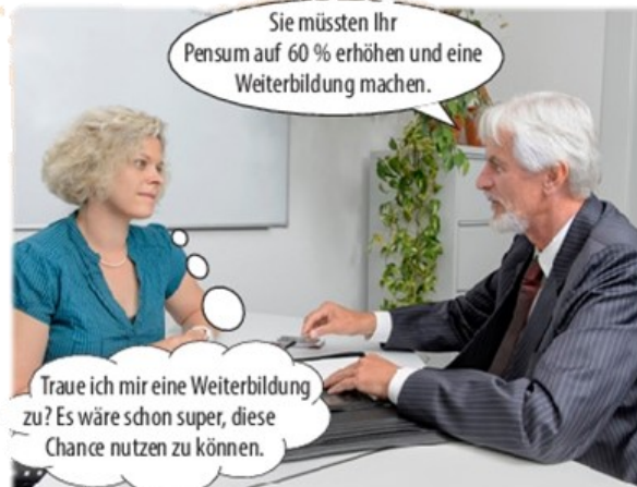
Christiane erhält das Angebot, Nachfolgerin der Personalassistentin zu werden, die Ende Jahr in Pension geht.