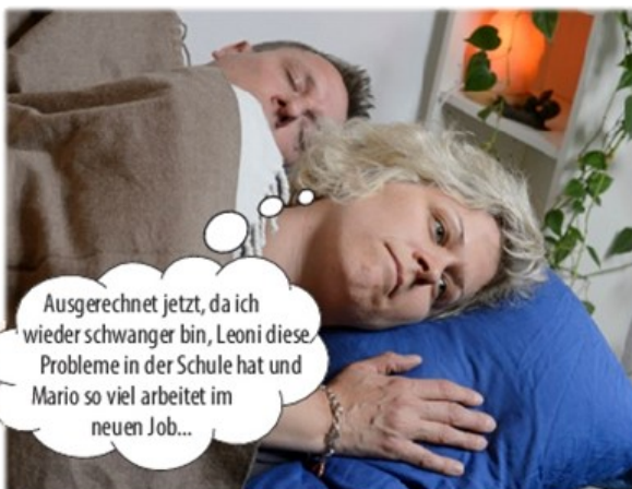
Die Frage ist nur, wie sie das alles unter einen Hut bringen soll? Wer kümmert sich um die Kinder und den Haushalt?