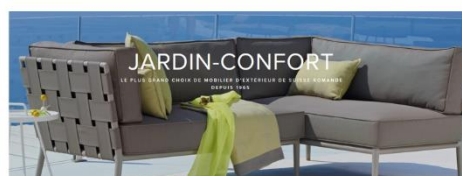
Gestionnaire de vente Magasin spécialisé dans le mobilier d'extérieur haut de gamme. Le plus grand choix de meubles de jardin et de terrasse de suisse romande depuis plus de 50 ans. Pour renforcer l'équipe de notre magasin à Lutry nous cherchons un ou une